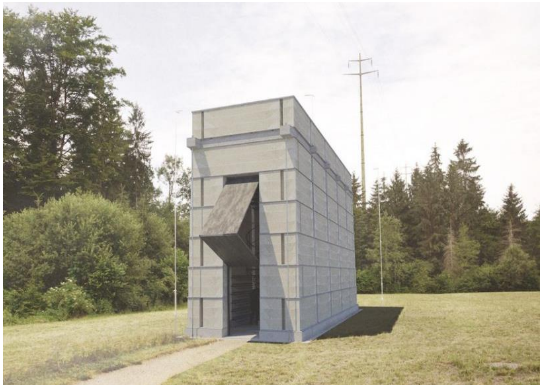
(Fotomontage: Boltshauser Architekten AG)

Das Bauprojekt setzt auf neuartige, technische Innovation: Die aus Stampflehm gefertigten Wandelemente wurden vorgefertigt und weisen eine eigens entwickelte Vorspannung von Stahlstäben auf.